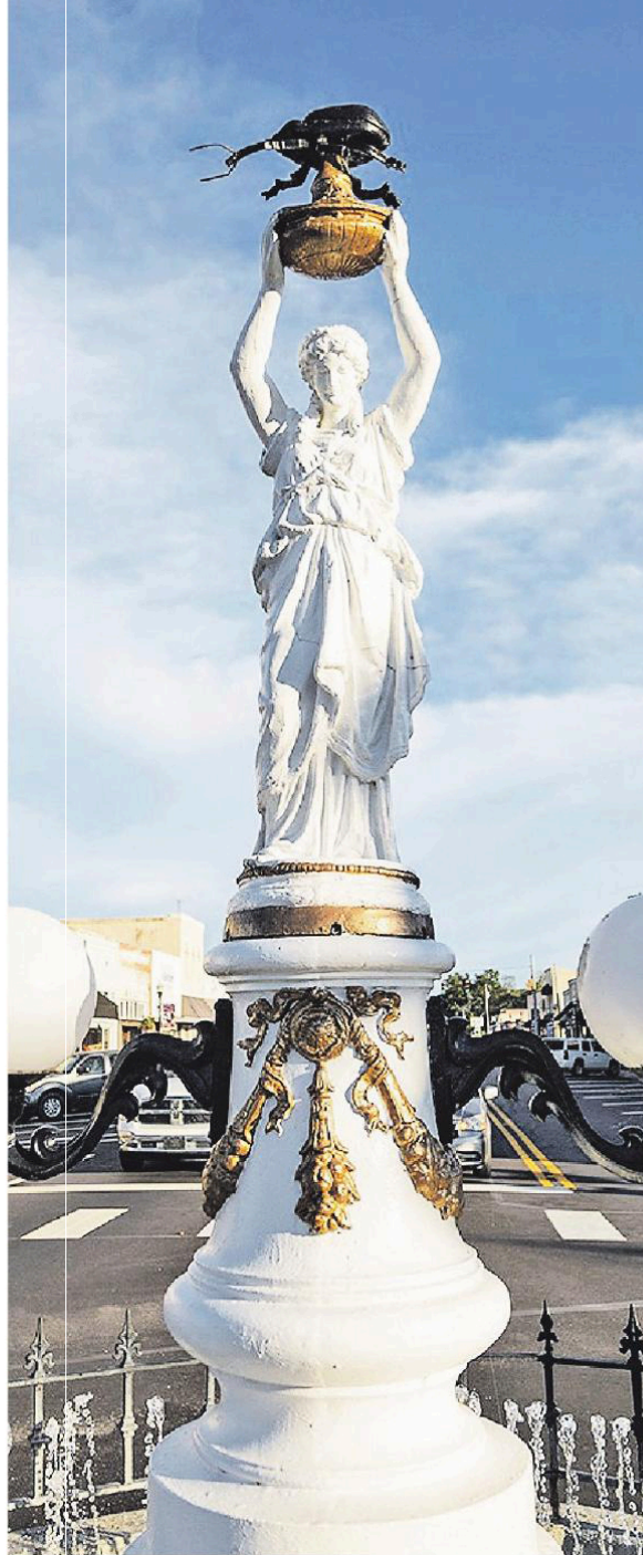
Pomník chrobákovi, ktorý zničil bavlníkovú otrokársku plantážu v meste Enterprise.

Náš terajší aj vtedajší premiér Andrej Babiš vyrazil v roku 2019 na Vysočinu a tam si pred kamerami na dlani pre-